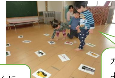
カードゲーム。 よーい、ドン！パトカー は、どこにあるかな？