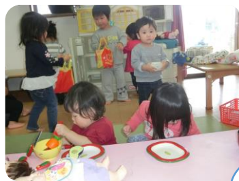
一緒に活動をしたり給食を 食べたり、交流をしています。