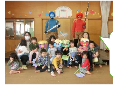
仲良くなれたかな？ ドキドキで撮ったよ。