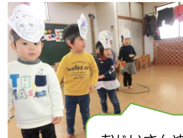
おじいさんやおばあさん になったよ