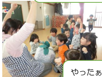
やったあ〜、 カブが抜けた！！