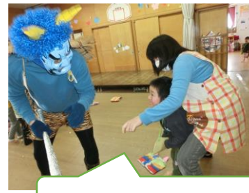
・・・怖くないもん！！