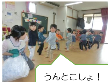
うんとこしょ！ どっこいしょ！