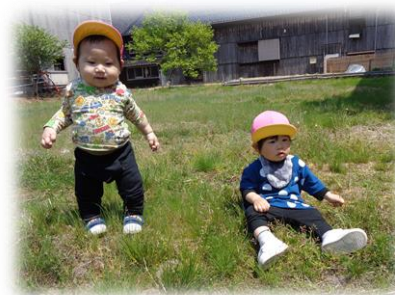
農協倉庫裏の原っぱ♪探索が楽しいね