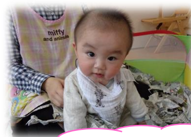
新聞紙で遊んだよ