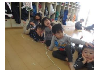
粘土でなが～いへビ(>_<)

友だちとの関わりが楽しくなってきたゆり組さん。「何して遊ぶ？」「一緒に遊ぼう！」と誘い合う姿が多く見られています。一緒に何か作り上げることの楽しさを感じている様子で、砂場では川を作って遊んだり、粘土遊びでは部屋中に細く丸めた粘土を繋げて、ながいなが～いへビを作ったり！！関わりの中では、意見の食い違いで喧嘩すること多いのですが、自分の思いばかり通そうとしていた以前に比べ、友だちの思いを聞いて「それじゃあこうしよう！」と受け入れられるようにもなってきました。「か～ぜ～て～」「ダメ！」というやりとりもまだまだ多い日々ですが…お互いに思いを伝えあいながら、トラブルになっても気持ちに折り合いをつけられる子ども達に育てて欲しいな…と願っているところです。