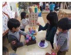
お店屋さんごっこ(*^^*)