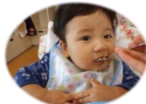
大きなお口で「あ〜ん♡」