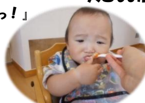
「もぐもぐ…おいしい??」