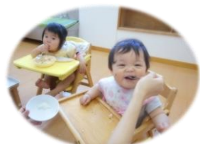
「あ〜ん…」おいしい笑顔♡

この間まで、ミルクを飲んでた子が多かったもも組さん。みんな2回食や3回食へ移行し、保育園でもおいしいご飯が食べられるようになりました。スプーンを使ったり、手づかみで食べたり…みんな意欲的にモリモリ食べていますよ！