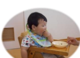
手づかみで「ぱくっ！」