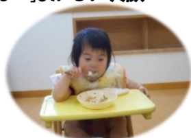
「自分でスプーンで食べられるよ♪」