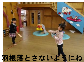
羽根落とさないようにね！