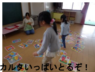
カルタいっぱいとりぞ！