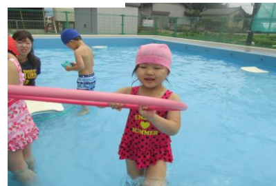
水に顔をつけられるよ！