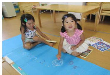
可愛いおばけ描いてるよ☆