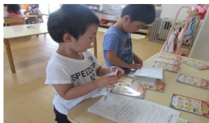
角と角を合わせてチャレンジ！

これまでのお便りは、折った物をノートに挟んで持ち帰って持ち帰っていましたが「自分でやりたい！」と言う声が多く聞かれるようになり、今月から取り組んでいます！年中児は昨年度もしたことがあるため、角と角を合わせきれいに折ることができたり、年少さんに教えてあげたりしています(*'▽')年少さんは新しい活動に興味を持ち、意欲的に取り組んでいます。まだうまく角と角を合わせて折ることが難しいですが、「ママとパパに自分でやったよって教える！」と張り切っていますので、子どもたちが折ったお便りに目を向けていただけたらと思います♡