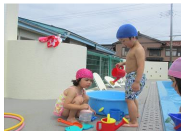
プールサイドで遊ぶのも 楽しいな～