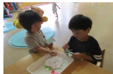
年長さんみたいにおばけやしきの受付に挑戦