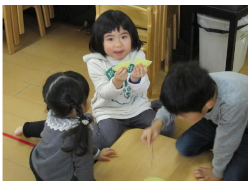
おせんべいゲッター！

11日に、にこにこ新年会がありました。カルタとり・すごろく・福笑い・コマ回し・風船羽根つき・せんべい釣りの正月あそびを楽しみました。子どもたちに人気があったのは、せんべい釣りでした。「食べたい」と言う気持ちはあるものの、上手く針を刺せずに苦戦していると、年長児が代わりにせんべいを取ってくれ、嬉しそうにしていた子どもたちでした！また、ひらがなが読める子はカルタとりをしたり、コマ回し・風船羽根つきでは、やるうちにコツを掴んで楽しんで遊んだりしていましたよ(^O^)正月ならではのあそびを存分に楽しみました☆