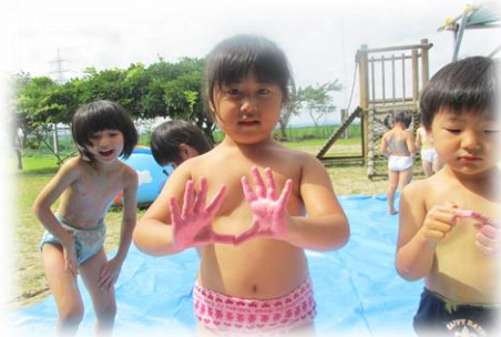
ピンクの絵の具ぬりぬり~♪

園庭では、先週からボディペインティングが始まりました。好きな色の絵具を自分の体やお友だちの体にぬりぬり…。「冷たくて気持ちいいね!」「ピンクと黄色混ぜてみよう!」と体中カラフルになりながら絵の具の感触を楽しんでいますよ!終わった後は、プールあそびで汗も絵の具もきれいさっぱり洗い流して思いっきり楽しんでいる子どもたちです(^_^)/