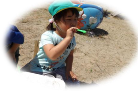
「しゃぼん玉できたよ!」