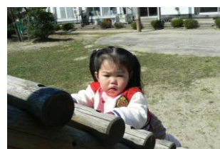
もう少しで滑り台♪