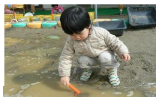
シャベルでそっとすくって...