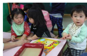
皆でマグネットあそび!